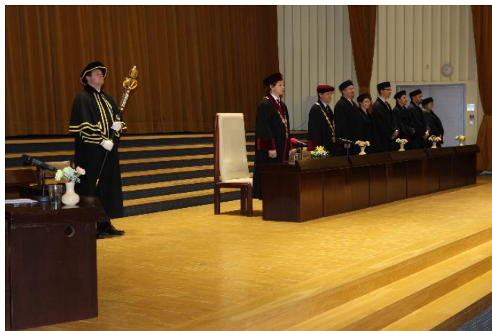
Promoce (ilustrační foto)

Konzultačního střediska Provozně ekonomické fakulty České zemědělské univerzity v Praze bylo otevřeno v říjnu 2002. Od akademického roku 2003/2004 v něm probíhá výuka v rámci bakalářského studia a od akademického roku 2006/2007 také v rámci navazujícího magisterského studia programu „Veřejná správa a regionální rozvoj“.