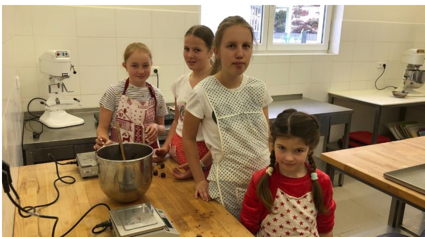
S dětmi v kuchyni – Vánoční pečení (12. 12. 2021)