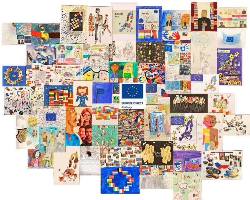
Koláž všech došlých prací literární soutěže „Jednotná v rozmanitosti“

Protože působností Europe Direct je celý Plzeňský kraj, vyjžděli jsme se stánkem také mimo Klatovy, do jiných částí našeho kraje (např. Plzeň, Rajsko, Krsy apod.).