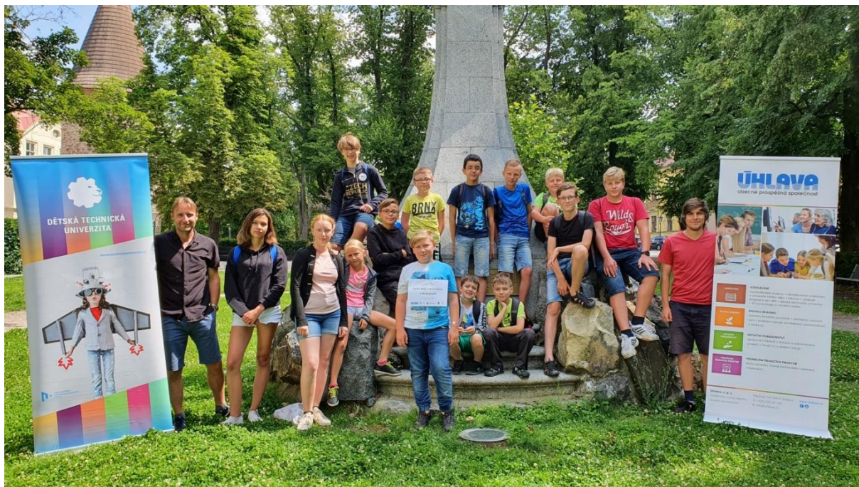
Zakončení třídních Letních dnů s technikou v Klatovech (červenec 2021))

V první polovině roku 2021 nebylo možné, vzhledem k protiepidemiologickým opatřením, učebny využívat. Ve druhé polovině roku už byly téměř plně vytíženy. Jednak při pořádání Letních dnů s technikou v červenci a kroužků DTU od září do konce roku. Ale také v rámci Univerzity třetího věku, při předmětu Moderní informační a komunikační technologie, při pořádání výukových programů pro základní školy (ZŠ Plánická, ZŠ Masarykova) a další zájemce (např. nízkopražový klub při Oblastní charitě Klatovy) nebo v rámci tradičních akcí jako je Dětská vědecká konference, Noc vědců apod. (viz dále).