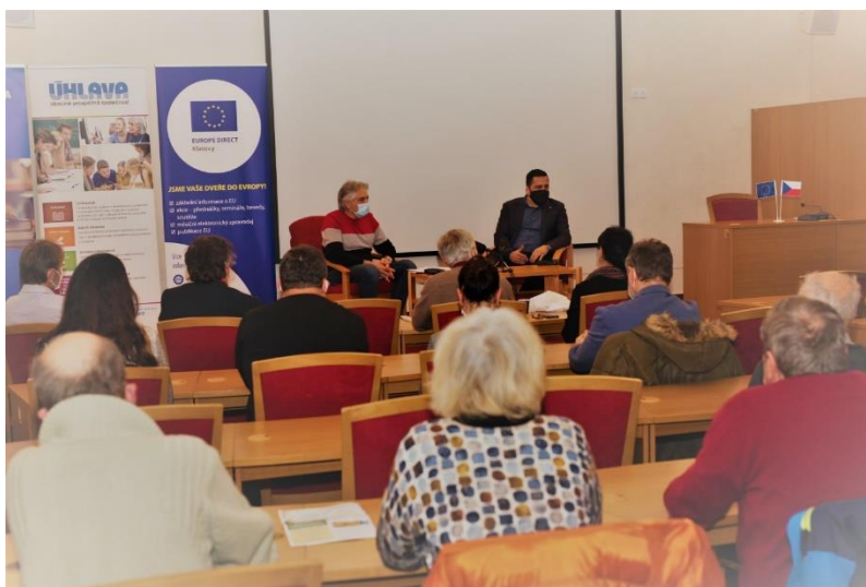
Beseda s Tomášem Zdechovským, poslancem Evropského parlamentu (12. 12. 2021)

„Dobrý, až velmi dobrý večer“ je cyklus besed se zajímavými osobnostmi. Pořádali jsme ho už v letech 2002-2005 a v říjnu 2019 jsme jeho pořádání obnovili. Spolupracujeme při tom s Rotary Clubem Klatovy a Městskou knihovnou Klatovy. Naším cílem je nabídnout zájemcům z řad veřejnosti zhruba jedenkrát měsíčně setkání se zajímavou osobností nad vážnými i méně závažnými tématy. Besedy pořádáme pravidelně, poslední středu v měsíci a vstup na ně je bezplatný.