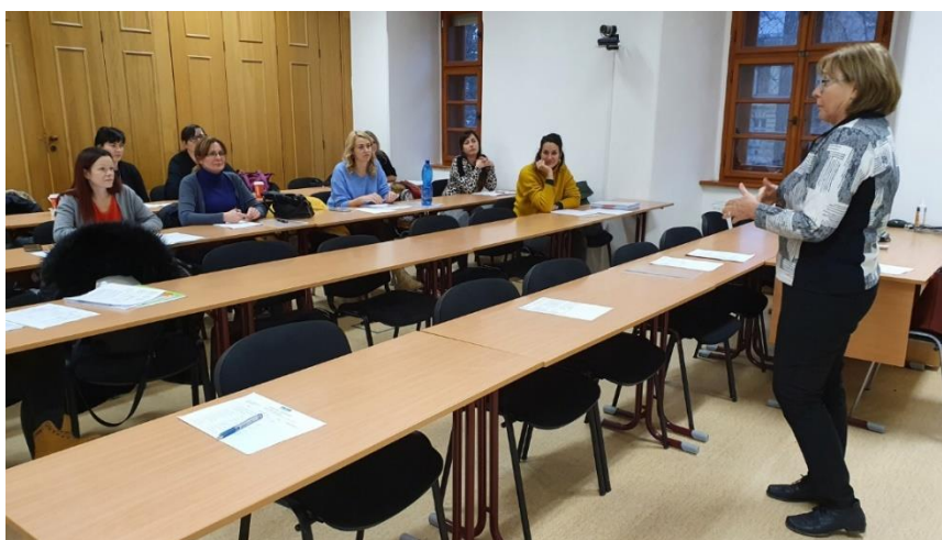
Rekvalifikační kurz Účetnictví (ukončení kurzu, 12/2021)