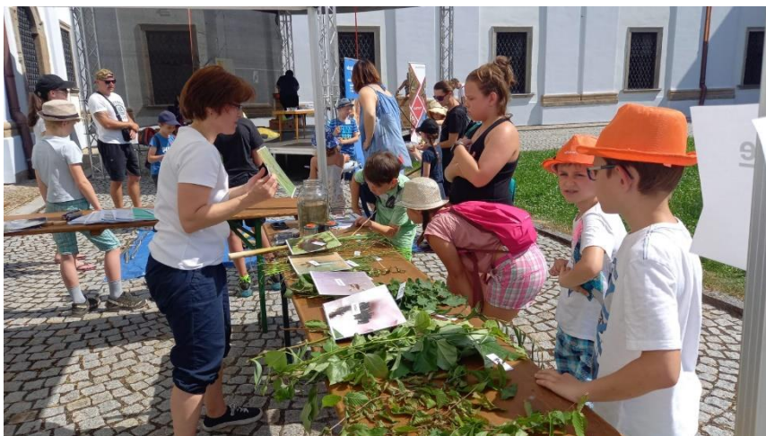
Workshop Vodní říše (Dětská vědecká konference)

Naše společnost se této akce zúčastnila již počtvrté. Tentokrát jsme připravili tři stanoviště. Dvě nabízející půlhodinové workshopy, vždy pro maximálně 15 dětí (během dne se na každém stanovišti workshop čtyřikrát zopakoval) a jedno stanoviště tzv. „mimochoodem“. To bylo připraveno