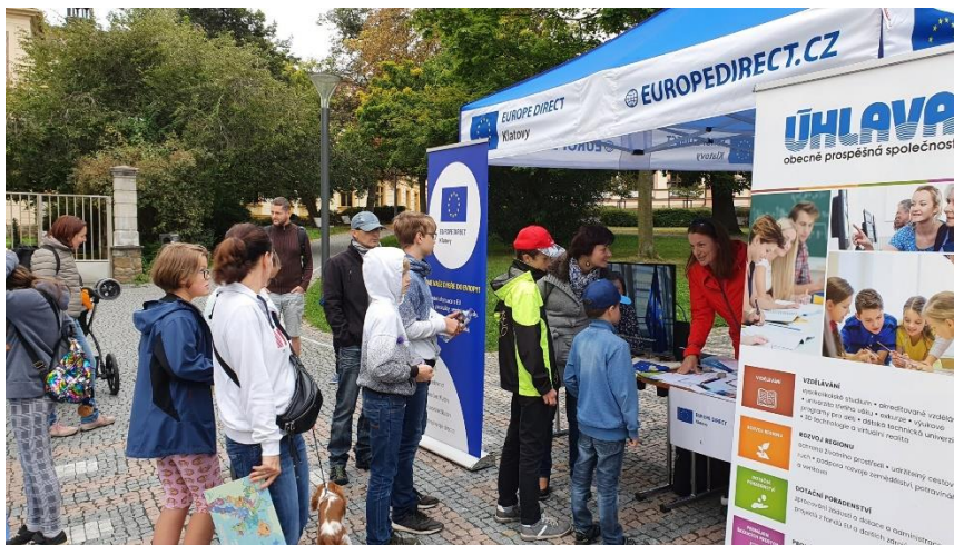
„Máme otevřeno 2“ – akce pro rodiny s dětmi (19. 9. 2021)