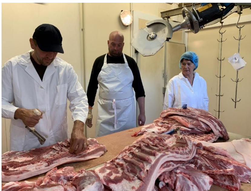
Kurz Zpracování masa (Náměšť nad Oslavou)

Další aktivitou, jejíž cílem byla podpora a vzdělávání farmářů v Pošumaví, byla realizace projektu „Diverzifikace činností v podmínkách malé farmy“. Od ledna do konce listopadu 2021 se uskutečnila série 4 vzdělávacích bloků zaměřených na problematiku zpracování a prodeje produktů prvovýroby. Celkem se proškolovalo více jak 40 účastníků, kteří absolvovali mlékařský kurz s výrobou kysaných mléčných výrobků a sýrů, sadařský kurz s praktickou ukázkou řezu ovocných stromů, kurz zpracování masa v Náměšti nad Oslavou či workshop s exkurzí na téma „Příklady možností odbytu regionální produkce“. Projekt byl spolufinancován z Programu rozvoje venkova, Podpora místního rozvoje na základě iniciativy LEADER.