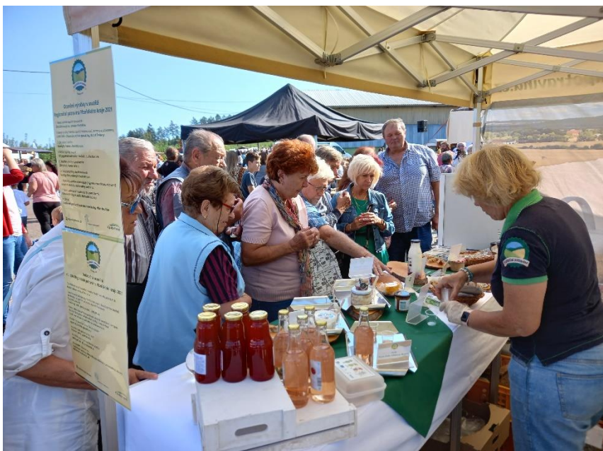
Ochutnávka vítězných potravin

Obecně prospěšná společnost Úhlava ve spolupráci s MAS Pošumaví měla opět tu