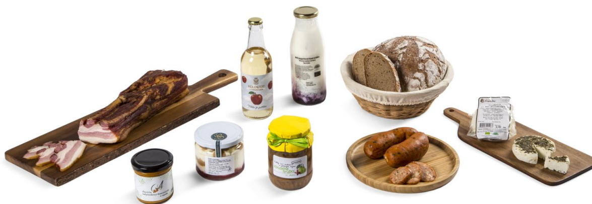
Vítězné produkty soutěže Regionální potravina 2021 (Plzeňský kraj)