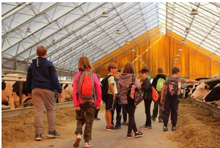
Exkurze v Agrospol Malý Bor, a. s.

Na podzim 2021 byl otevřen první ročník, do kterého se přihlásilo 14 dětí 3. až 5. tříd nejen z Klatovska, ale i z Domažlicka a Plzně jihu. V „zimním semestru“ se podařilo zrealizovat 10 lekcí včetně exkurze na farmu do Agrospolu Malý Bor. Probrali jsme např. půdu, pěstování a využití obilovin, ovocnářství, ale i počasí nebo včely. Vedle teoretického základu nechyběla vždy ani praktická část, a tak jsme založili na zahradě Střední školy zemědělské a potravinářské v Klatovech políčko s ozimou pšenicí, moštovali jsme nebo namleli mouku a upekli koláče.