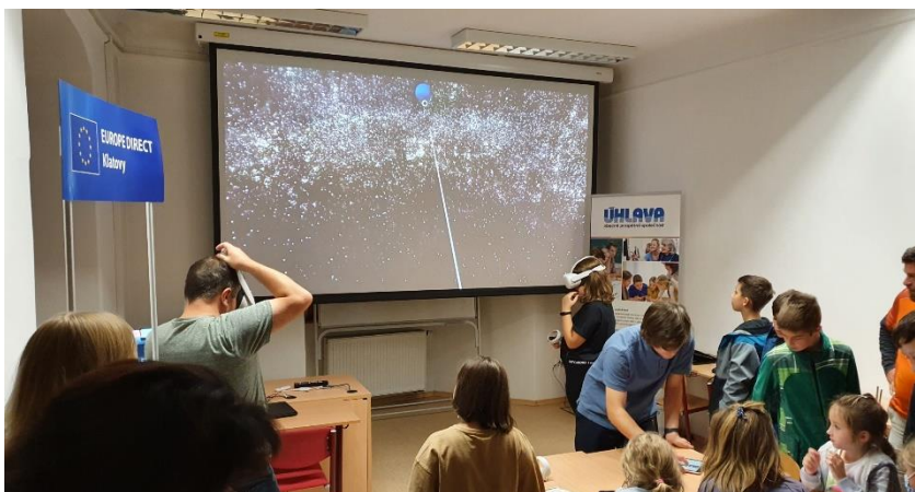
Noc vědců – Sluneční soustavou ve virtuální realitě (24. 9. 2021)

Tématem letošní Noci vědců byl „Čas“. Pro zájemce jsme v naší učebně virtuální a rozšířené reality připravili workshop na téma „Sluneční soustavou ve virtuální realitě“. Jak dlouho trvá jeden den nebo jeden rok na různých planetách Sluneční soustavy?