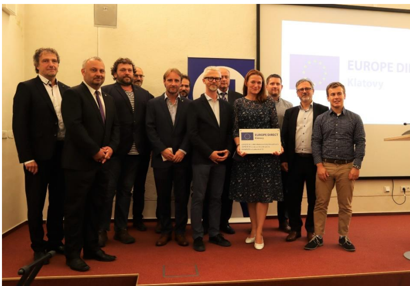
Předání plakety EUROPE DIRECT Klatovy (16. 9. 2021)